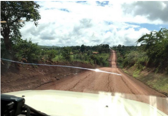
منظر الطريق في بوروندي من سيارة الفريق الجوال